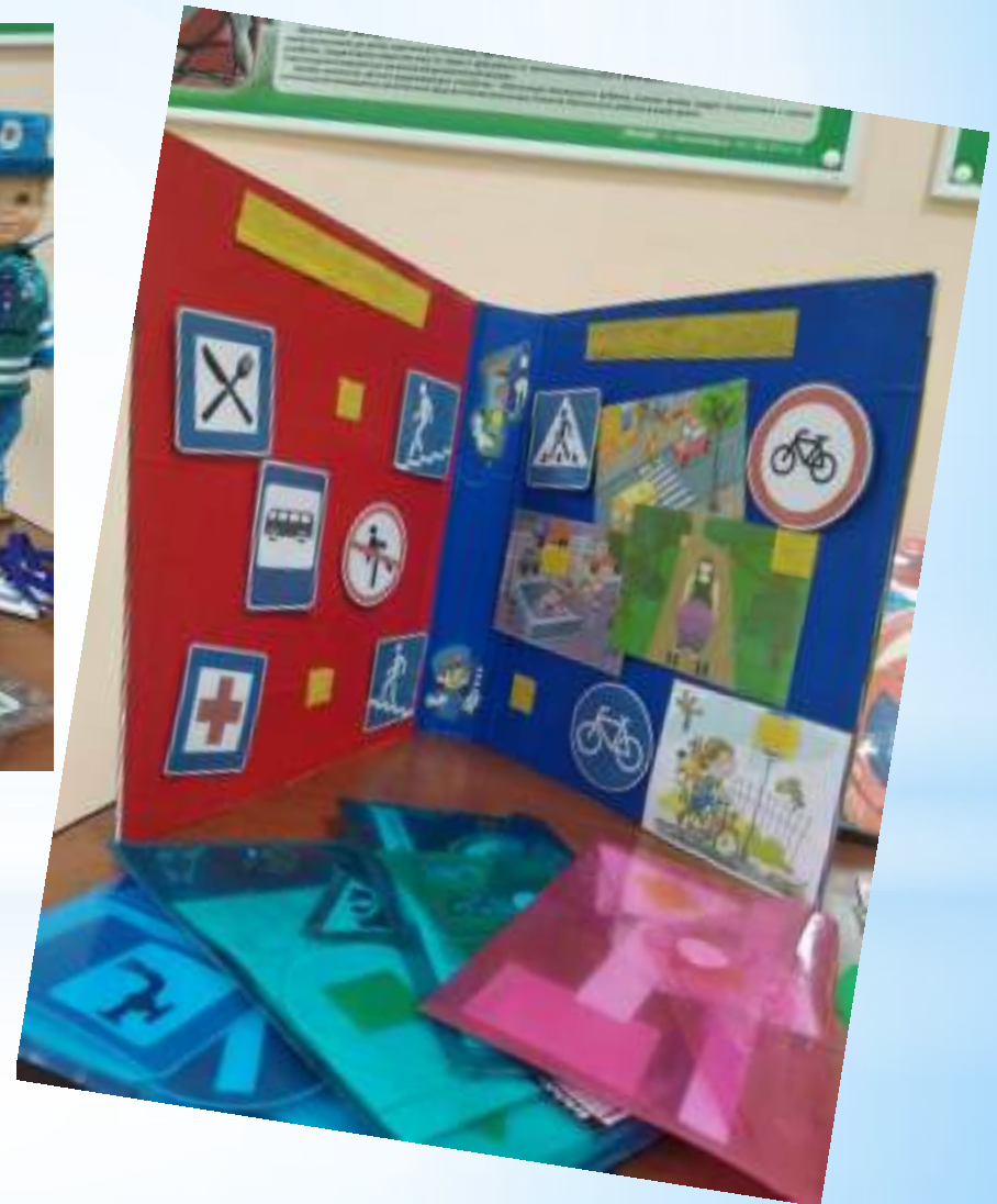
Лепбук «Дорога и я»