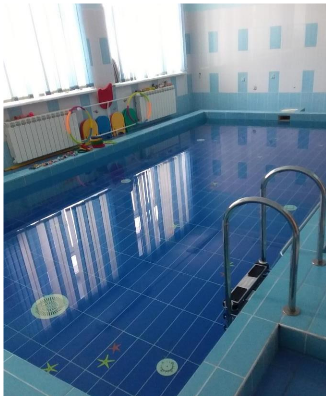
Тонущие игрушки (профилактика плоскостопия и осанки)