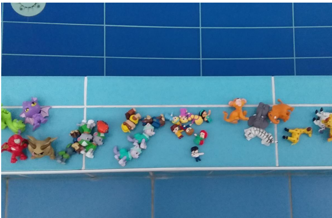
Игрушки разной плавучести

Игрушки тонущие используются для развития мелкой моторики, навыков ныряния