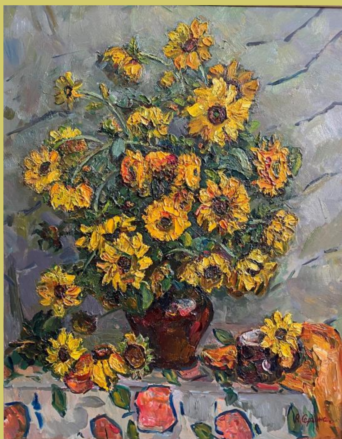
Натюрморт с подсолнухами.2003г.