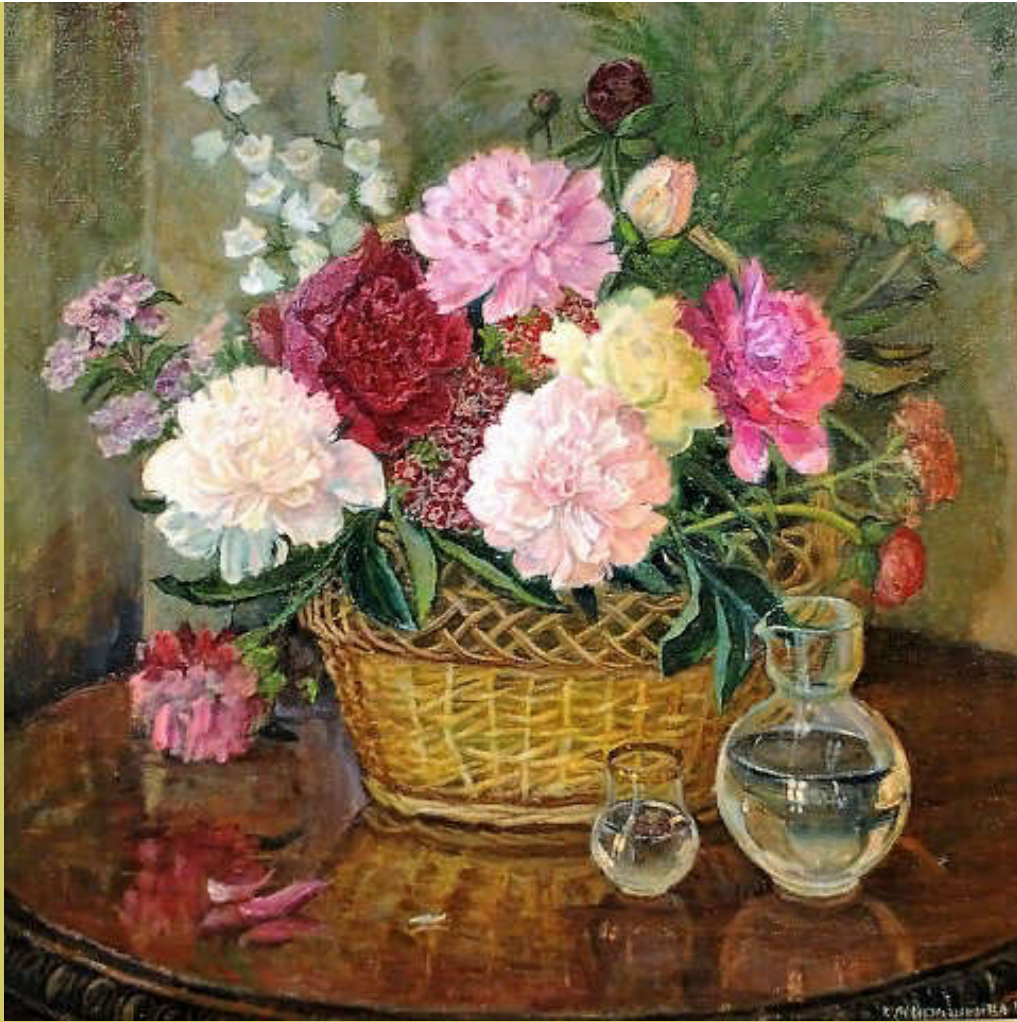
Пионы. 1991 г.