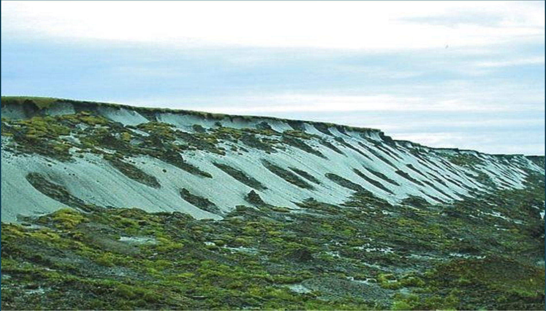
Природный ледоминеральный комплекс «Ледяная гора»