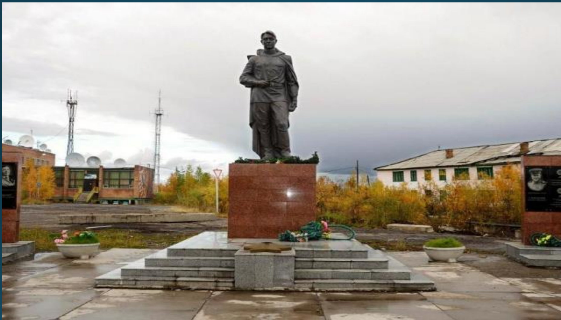
Мемориал в память о Победе в ВОВ