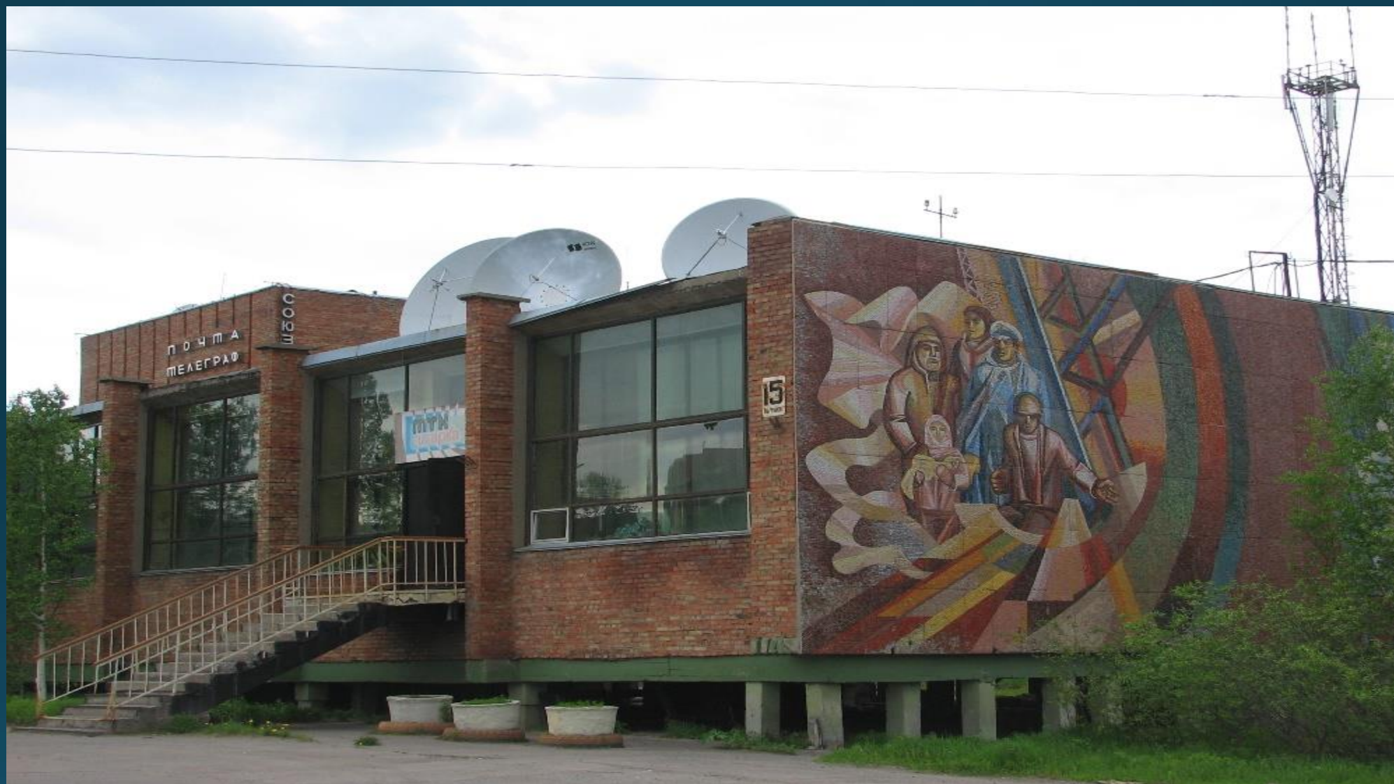
Кинотеатр в Игарке