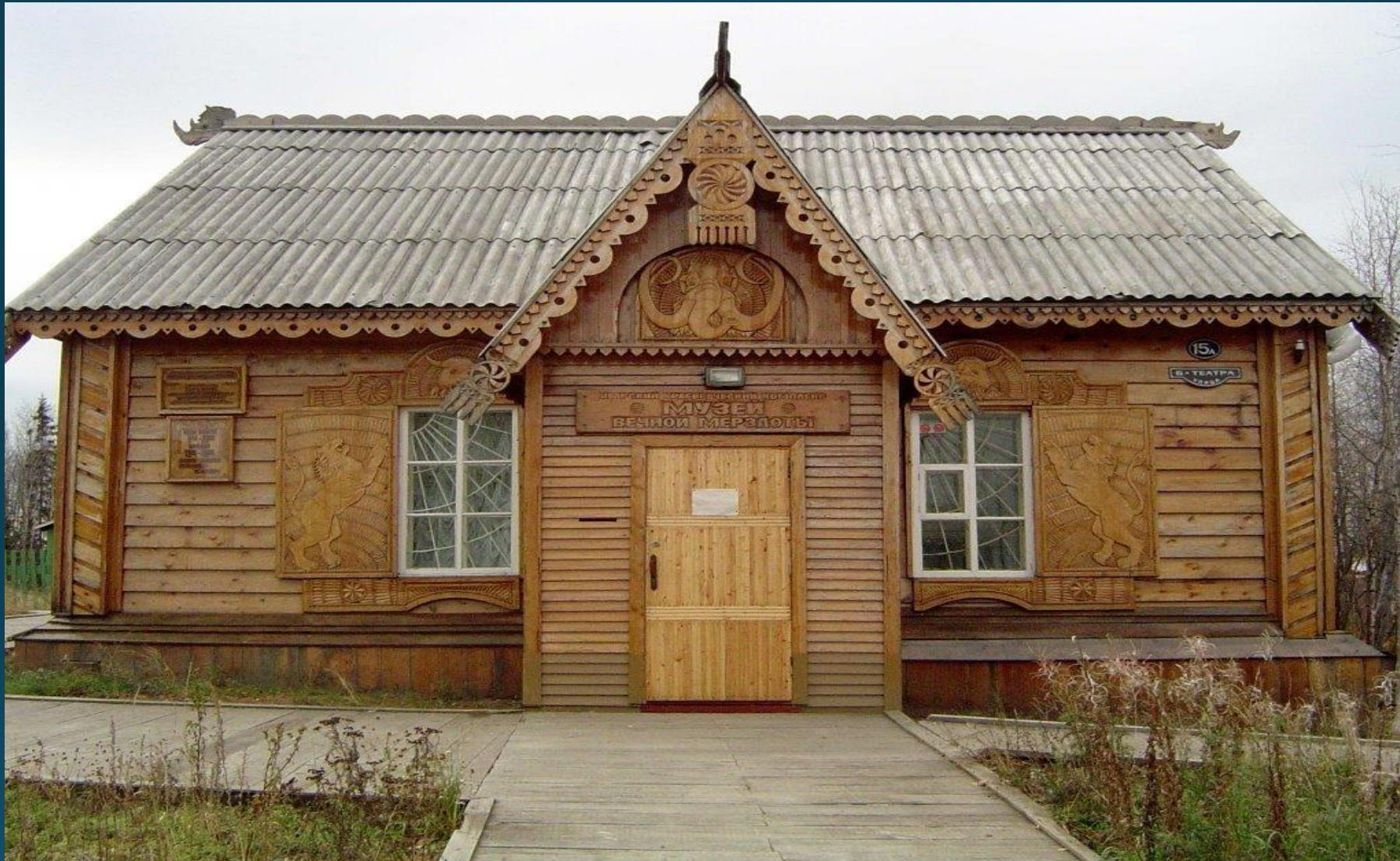
Музей вечной мерзлоты