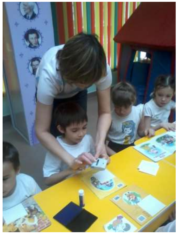
Превращение домашней книги в библиотечную!