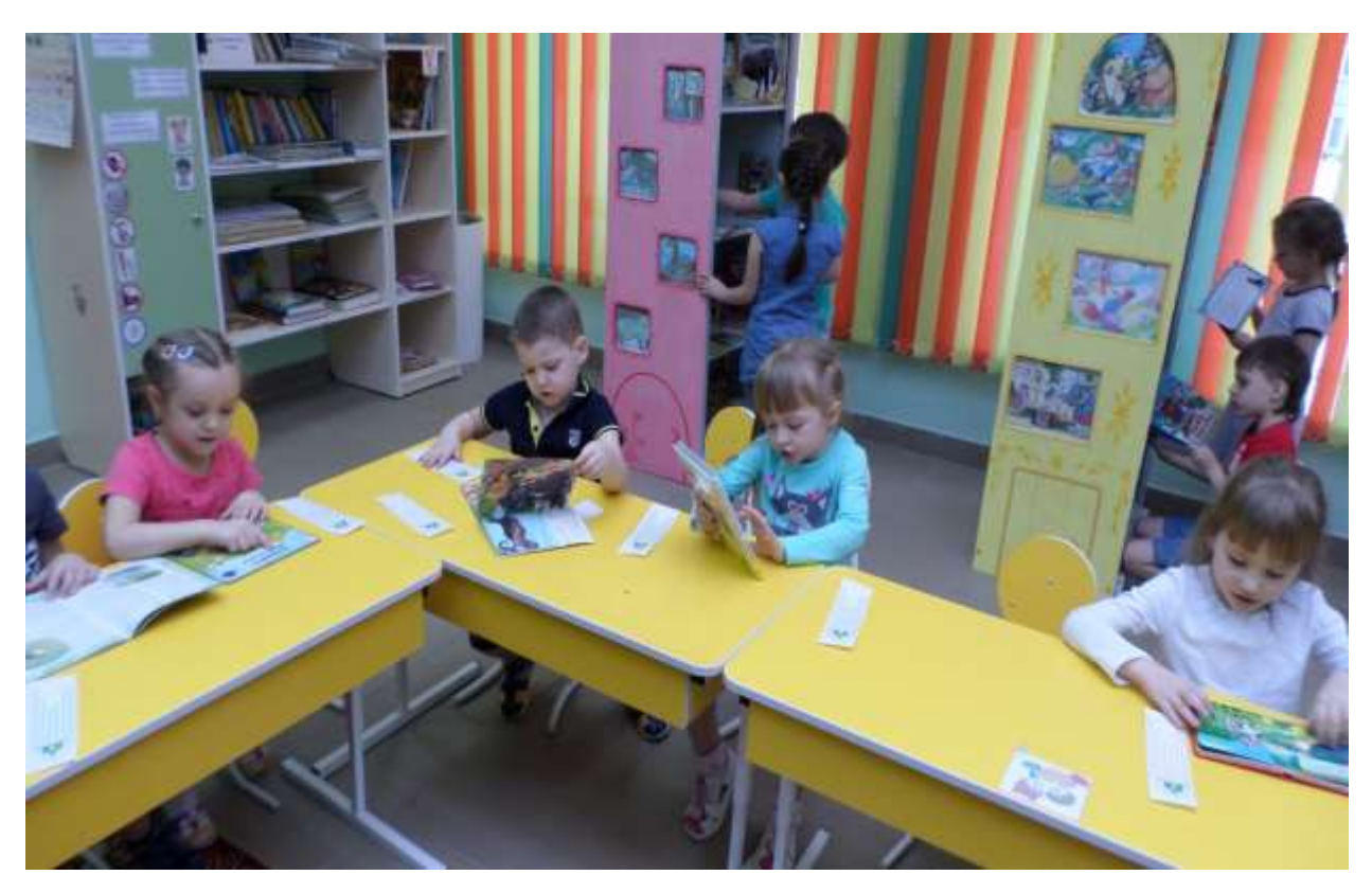
Мы не просто так пришли, мы теперь – ЧИТАТЕЛИ!