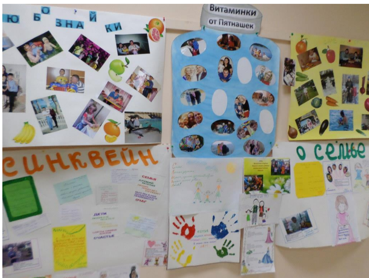
Обмен семейным опытом: опросник «Важней всего - погода в доме»