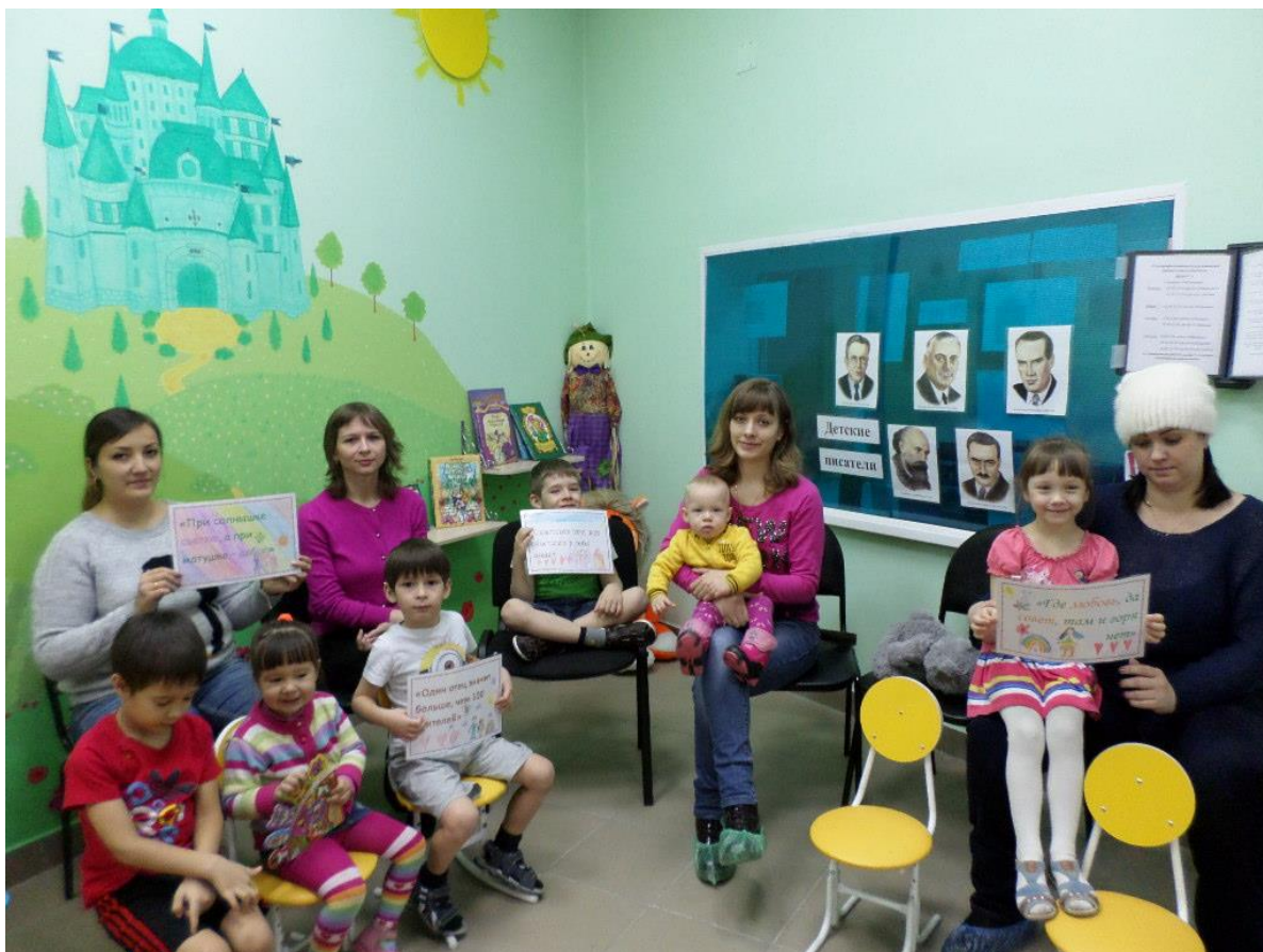
Конкурс «Синквейн о семье»